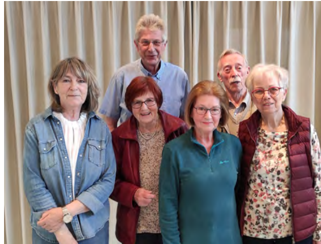
Die Besuchsdienstgruppe Georgenhausen-Zeilhard.

Sollte sich jemand vorstellen können, das Team zu verstärken, wären er oder sie herzlich willkommen!