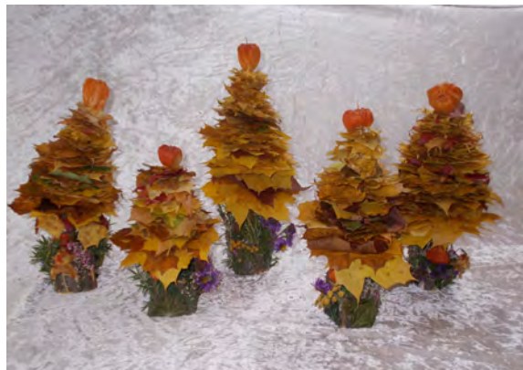
Herbstblätterbäume der MaLuKids.